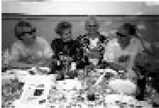
während die männer in herten beim lecker grillen sitzen und mit praktikantInnen flirten,